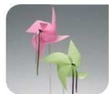
Moulins à vent

« Accessoires incontournables » : bougies lucioles qui illuminent vos tables, bulles de cristal, plumes d'anges, pliages en origami, ... pour le plaisir des yeux de vos convives. Tous les détails ont leur importance.